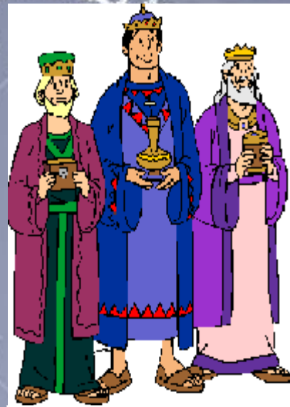
Traja kráľi, symbol nielen Stretnutia turistov na Sokole, ale aj samotných Vianoc

Kto ? ODBOR KLUBU SLOVENSKÝCH TURISTOV, Košeca