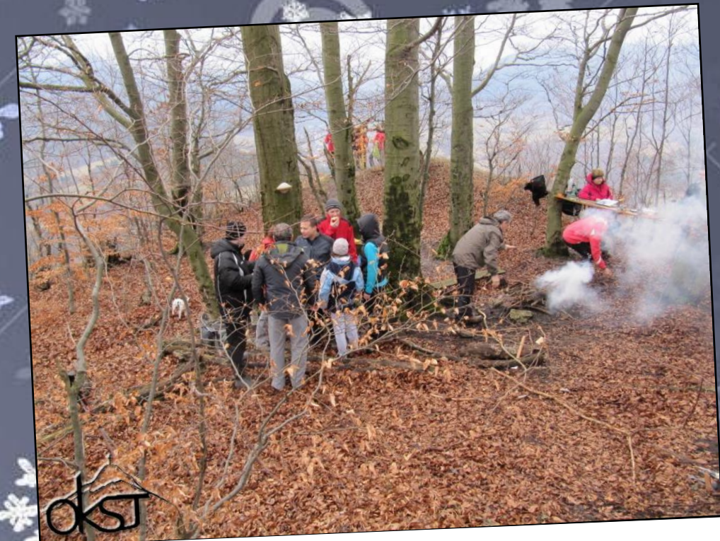
Zaslúžena chvíľka oddychu a vychutnávania sviatočnej atmosféry priamo na vrchole