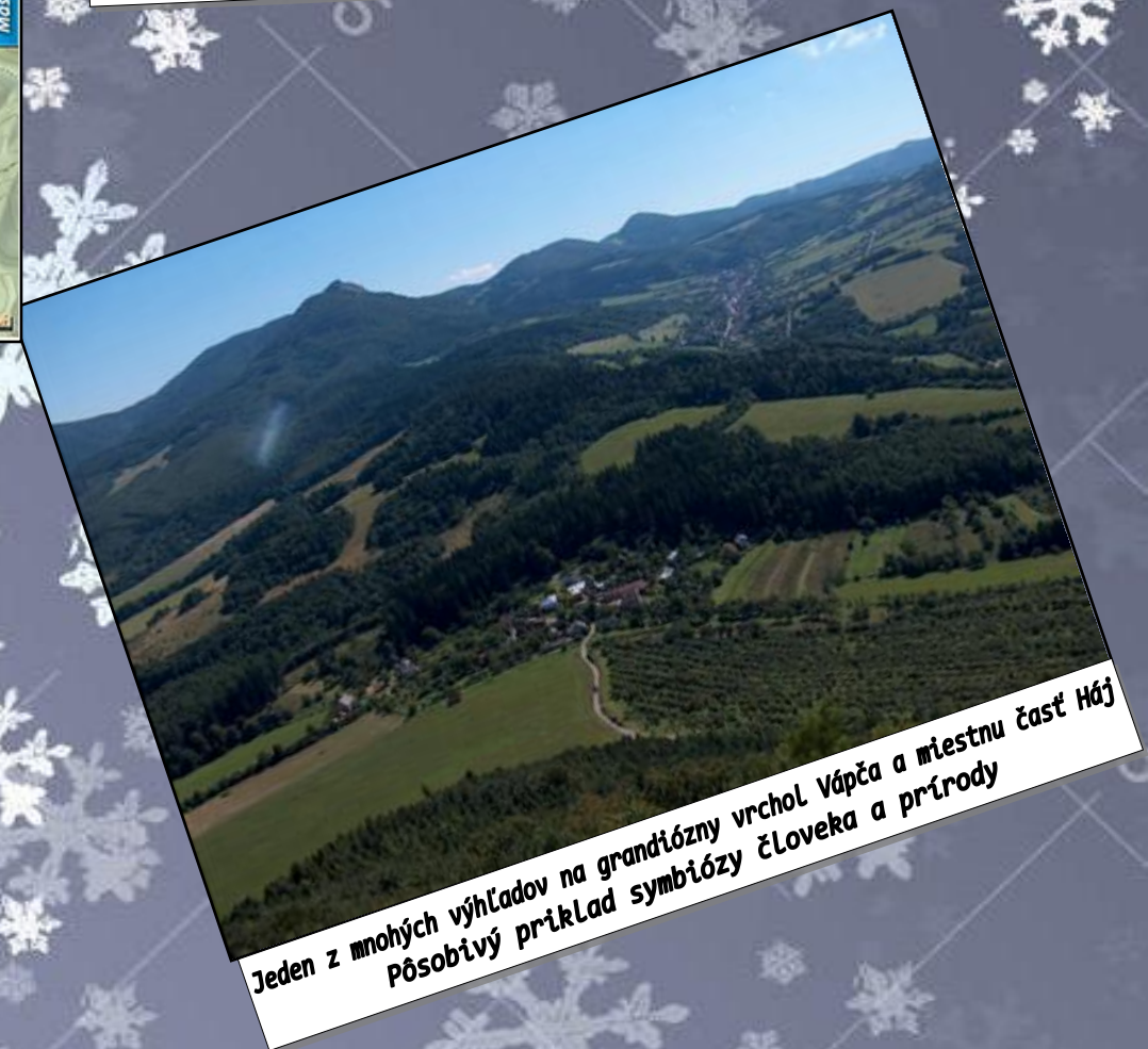
Jeden z mnohých výhľadov na grandiózny vrchol Vápča a miestnu časť Háj Působivý príklad symbiózy človeka a prírody

ODBOR KLUBU SLOVENSKÝCH TURISTOV Košeca 291 01864 Košeca IČO:37 915 312