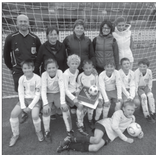
Torta od rodičov pre prípravku